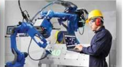
Мехатроника и робототехника