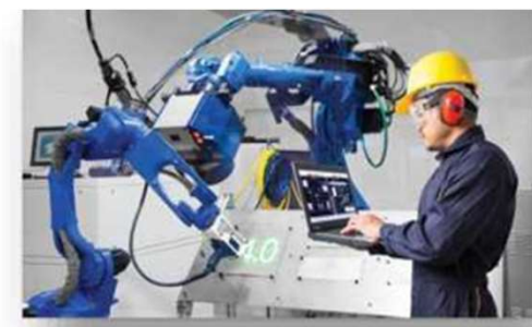
Мехатроника и робототехника