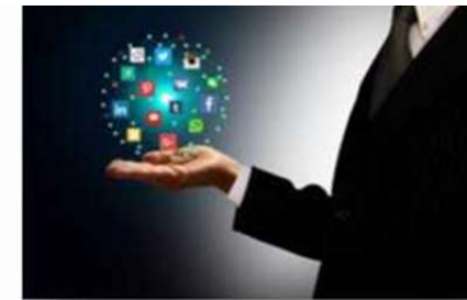
Управление социальными коммуникациями