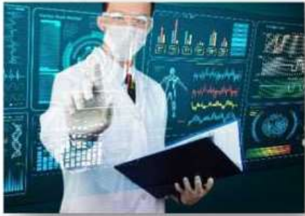
Педагог - дефектолог