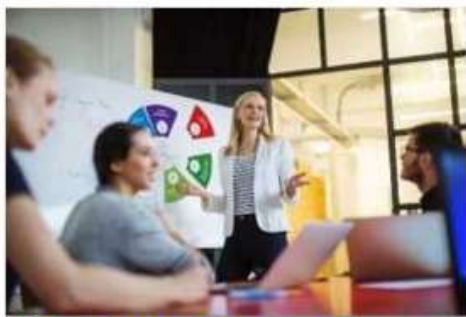
Реклама и связи с общественностью