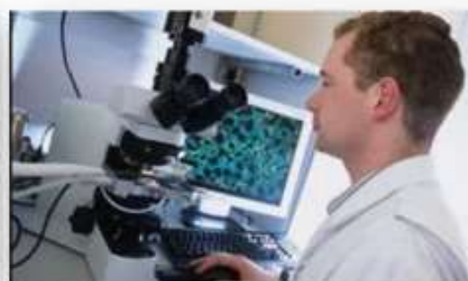
Электроника и наноэлектроника