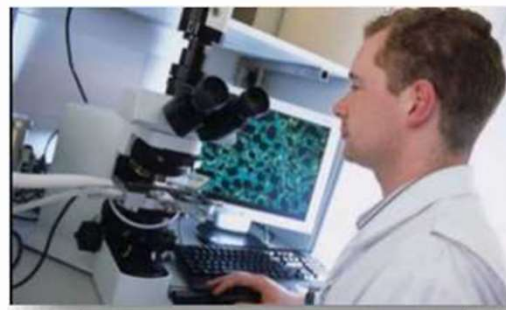
Электроника и нано электроника