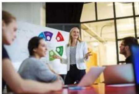
Реклама и связи с общественностью