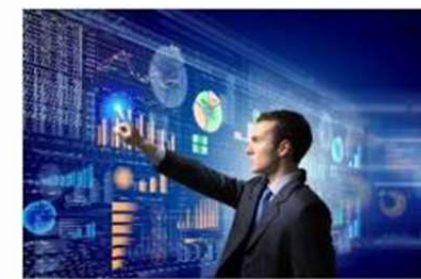
Бизнес - технологии