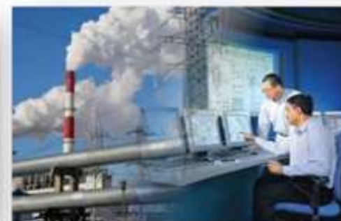
Электроэнергетика и электротехника