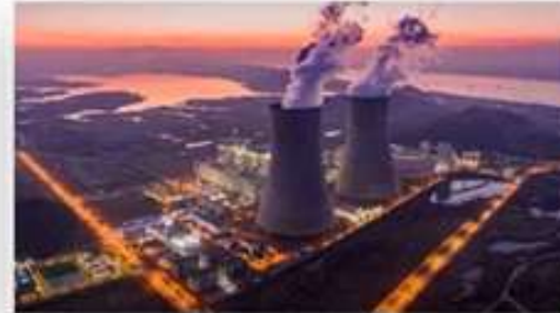
Физика и энергетика