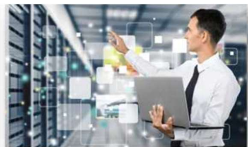
Прикладные математика и информатика