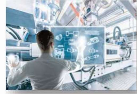
Информатика и вычислительная техника