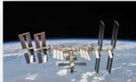
Аэрофизика и космические исследования