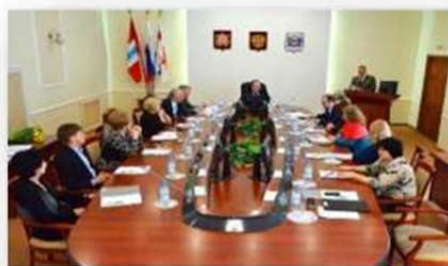
Государственное и муниципальное управление