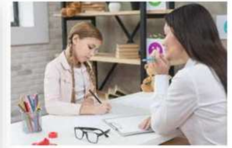
Педагог - психолог