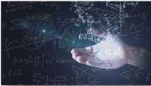
Общая и прикладная физика