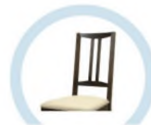
СПИНКИ СТУЛЬЕВ, НЕ ОБИТЫЕ ТКАНЬЮ И МЯГКИМ ПОРИСТЫМ МАТЕРИАЛОМ