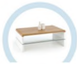
ЖУРНАЛЬНЫЕ СТОЛИКИ И ПРОЧИЕ ЖЕСТКИЕ ПОВЕРХНОСТИ