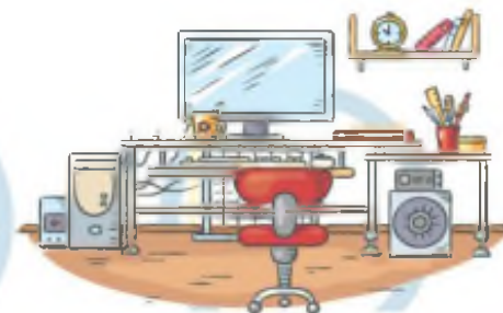
5. СООТВЕТСТВИЕ МЕБЕЛИ