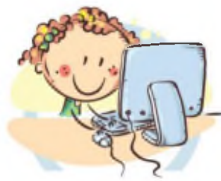
2. ПОЛОЖЕНИЕ МОНИТОРА