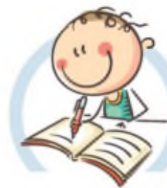
4. СИДИТЕ ПРАВИЛЬНО