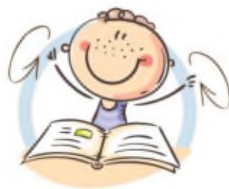
2. ФИЗКУЛЬТМИНУТКА ДЛЯ СНЯТИЯ УТОМЛЕНИЯ С ПЛЕЧЕВОГО ПОЯСА И РУК