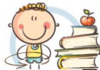
3. ФИЗКУЛЬТМИНУТКА ДЛЯ СНЯТИЯ УТОМЛЕНИЯ КОРПУСА ТЕЛА