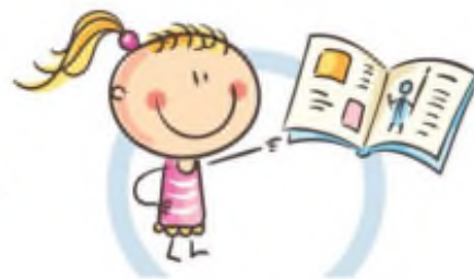
3. РАССТОЯНИЕ ДО КНИГ