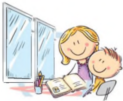
1. ЕСТЕСТВЕННОЕ ОСВЕЩЕНИЕ

ЕДИНЬИЙ КОНСУЛЬТАЦИОННЫЙ ЦЕНТР РОСПОТРЕБНАДЗОРА 8-800-555-49-43