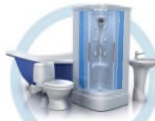
ТУАЛЕТ (УНИТАЗ, ВАННА, ДУШЕВАЯ КАБИНА, БИДЕ)