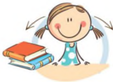
1. ФИЗКУЛЬТМИНУТКА ДЛЯ УЛУЧШЕНИЯ МОЗГОВОГО КРОВООБРАЩЕНИЯ