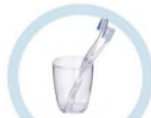
ТУАЛЕТНЫЕ ПРИНАДЛЕЖНОСТИ (ЗУБНЫЕ ЩЕТКИ, РАСЧЕСКИ И ПР.)