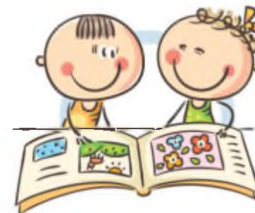
4. УПРАЖНЕНИЯ ГИМНАСТИКИ ГЛАЗ